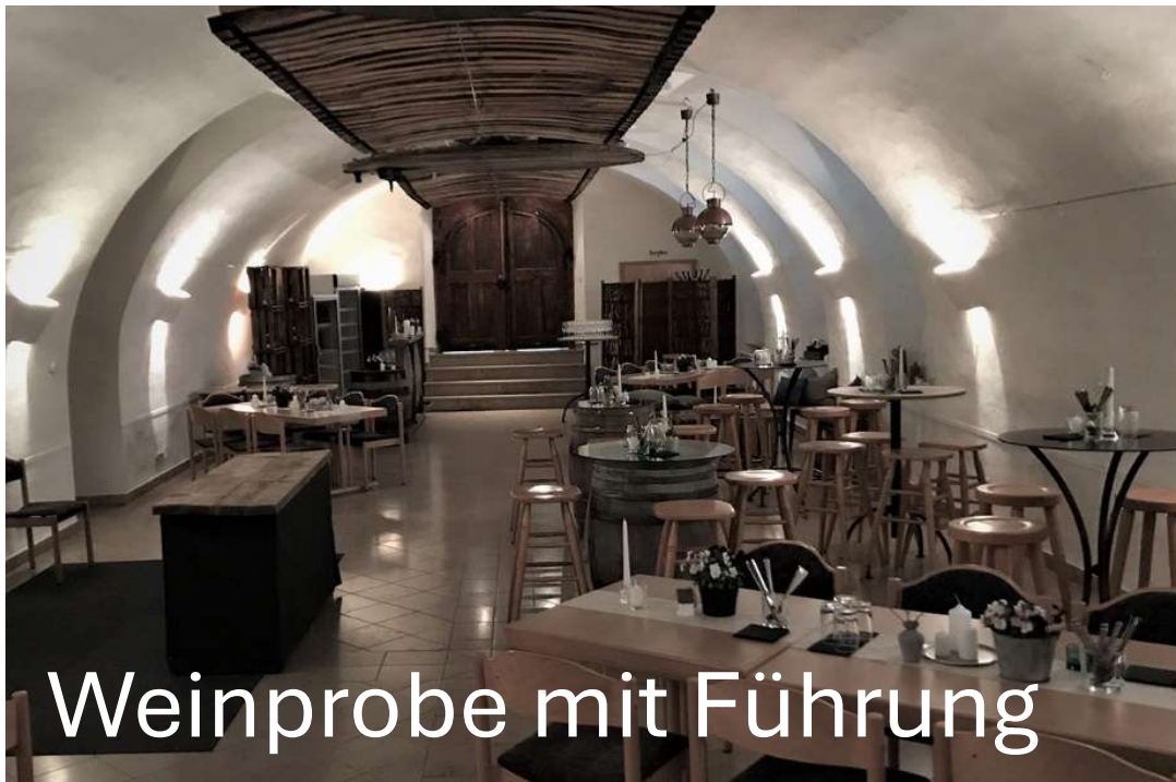
Weinprobe mit Führung