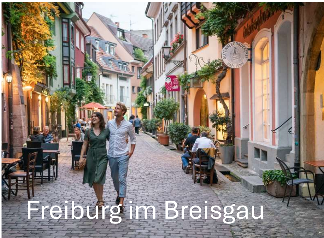
Freiburg im Breisgau